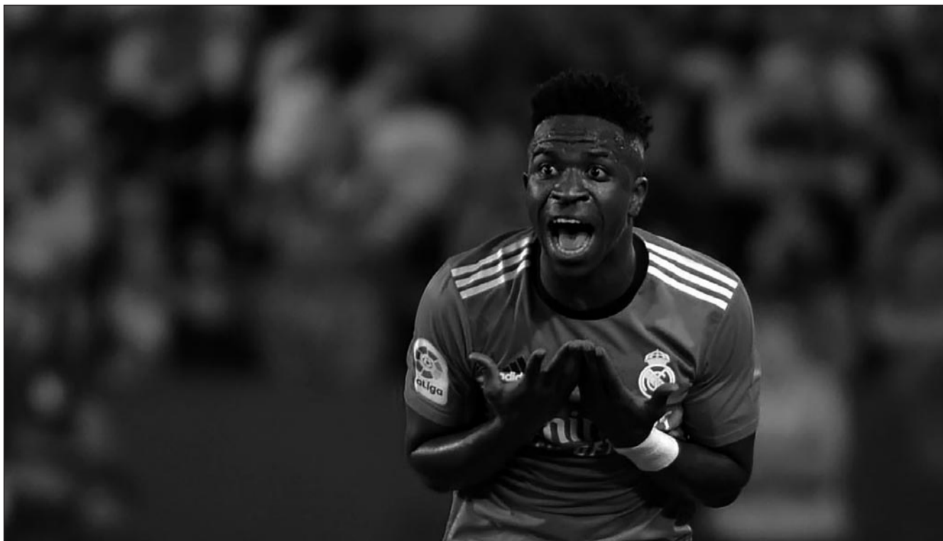
Vinicius protestando al árbitro.

En definitiva, Vinicius debería pedir perdón y retractarse de sus desafortunadas declaraciones antes de que el rechazo que ha generado siga en aumento. Es vital que entienda el impacto de sus palabras y que enfoque su talento en lo que mejor sabe hacer: jugar al fútbol.