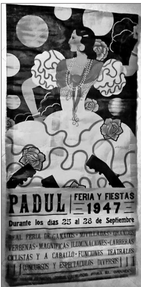
Cartel anunciador de la Feria de El Padul de 1947