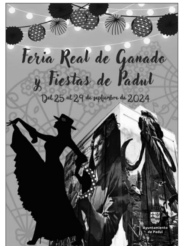
Cartel anunciador de la Feria de El Padul de 2024.