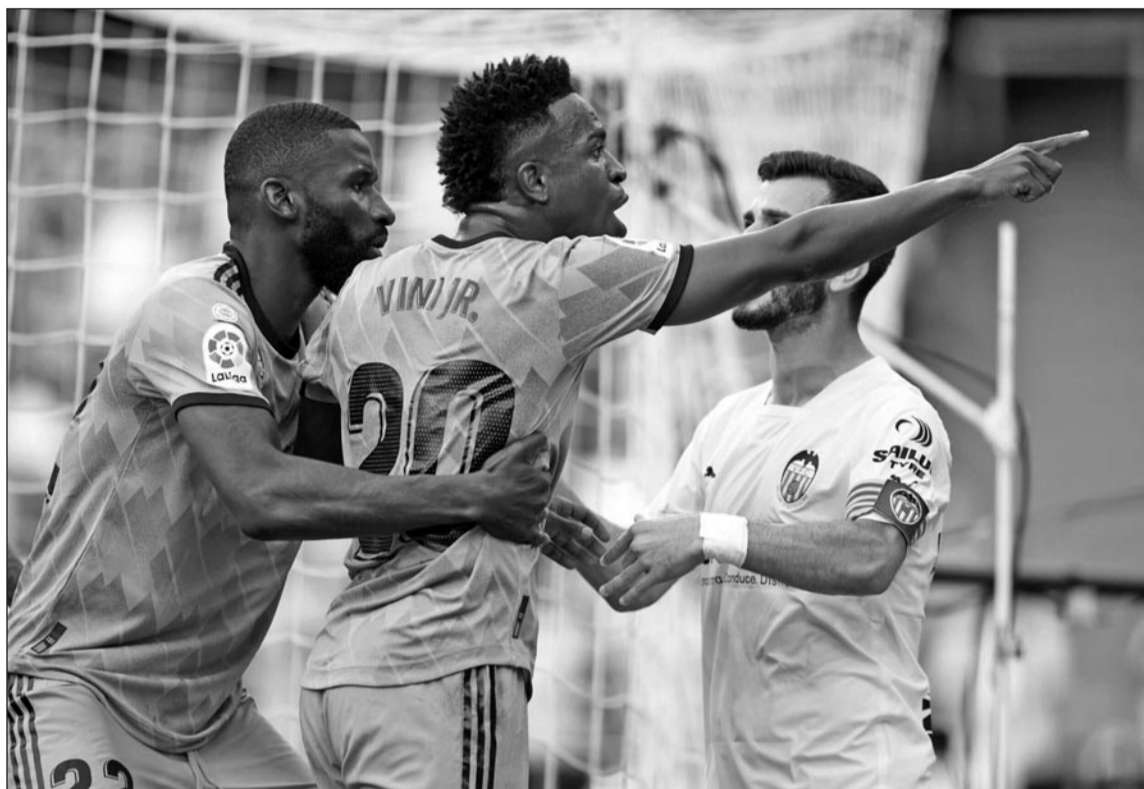
Vinicius discutiendo con otros futbolistas.

Lula expresó que no es aceptable que en pleno siglo XXI se sigan viendo actos de racismo tan fuertes en los estadios de fútbol y subrayó la importancia de tomar medidas efectivas para prevenir y castigar estos actos. Además, el gobierno brasileño instó a las