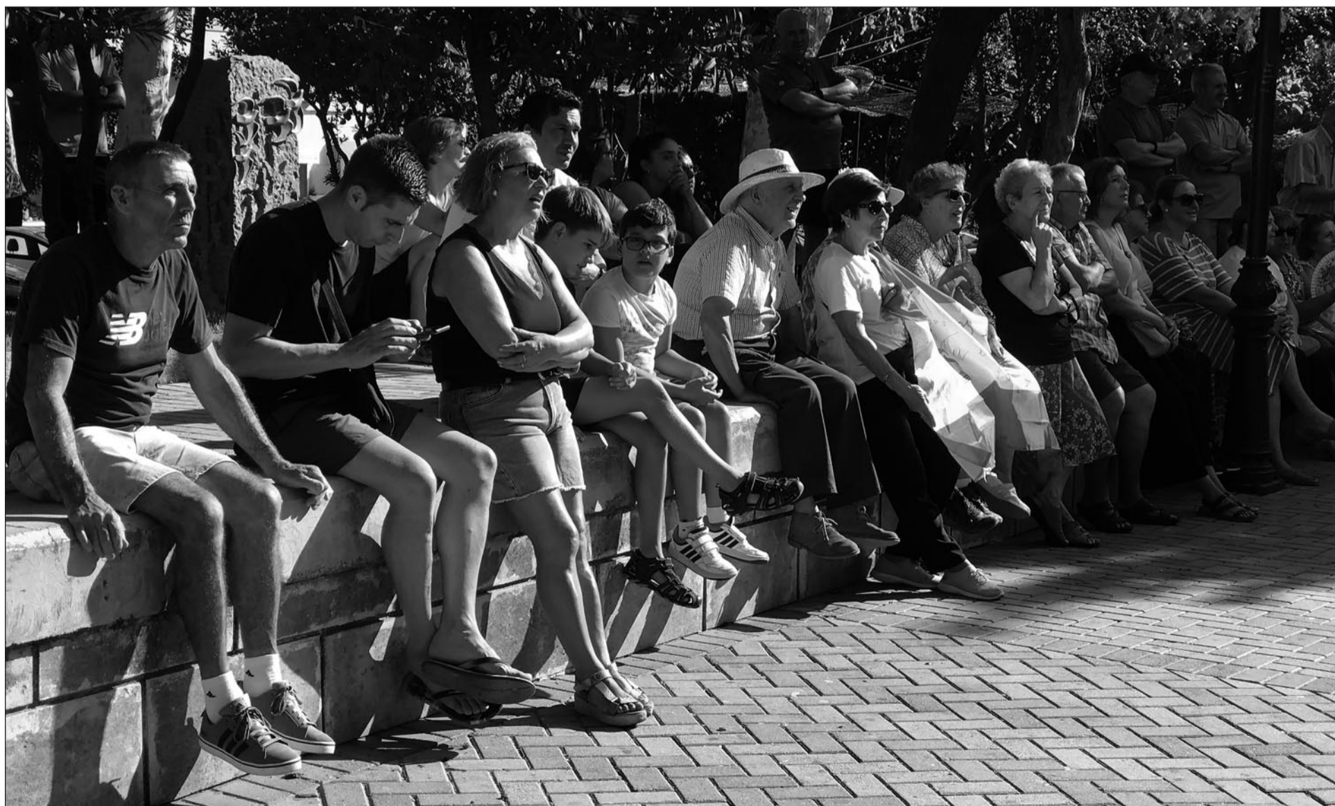
Foto de paduleños viendo la actuación de deportista paduleños en la modalidad de Paralímpicos, quedó en Séptimo lugar

Nuestro pueblo es grande, tiene unos 10000 habitantes y varía mucho en función de la población variable, osea, son muchas las personas que vienen buscando casas para comprar en Padul, esas personas vienen con sus vehículos y buscando casa y dando de alta sus coches o motos hemos llegado a tener 8.500 matriculados en el pueblo que eso supondrá también unos ingresos. Con respecto a la población que cito anteriormente, hemos llegado a tener 12.000 habitantes que en muchas ocasiones ha sido cambiante. Pero vamos progresando porque, aunque se tengan cosas positivas, también existen las negativas como puede ser la cuestión económica con deuda a costa de los paduleños que pagamos nuestros impuestos. Para terminar hemos visto como pasan los meses y cuando salga este periódico a la vista habremos pasado la Feria Real de Ganados. Pues tod a divertirse.