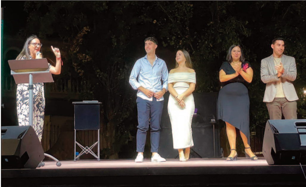
El alcalde y la concejala de fiestas momentos antes de la coronación