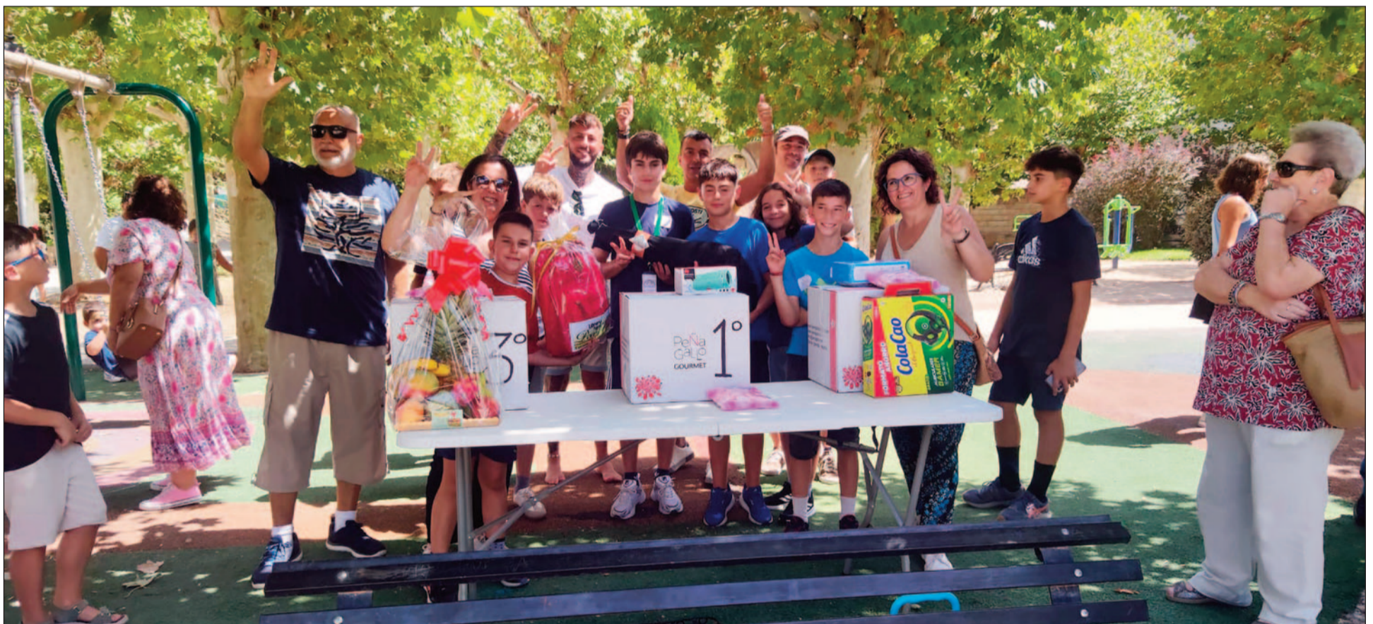
Gran diversión en el Torneo de Draibol de Dúrcal.