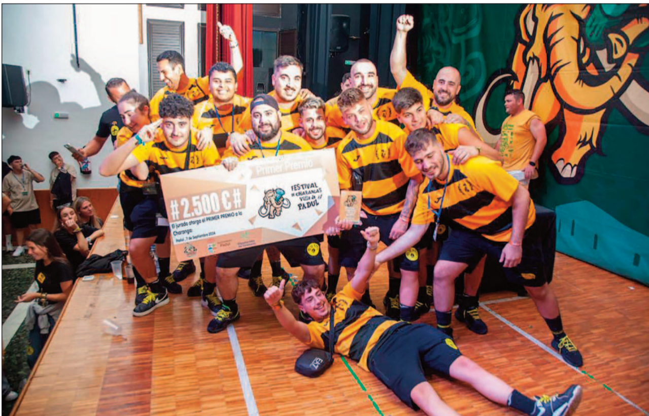
Charanga ganadora Mel de Romen de Valencia.

Adjunto enviamos fotos del acto tan precioso, de charangas y de público y que para el próximo año es estaremos esperando. Muchas Gracias a Todos.