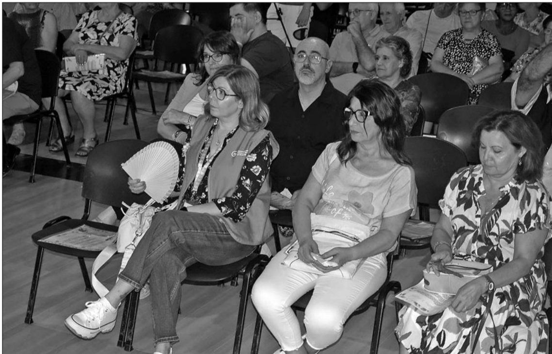
Algunos asistentes al acto.