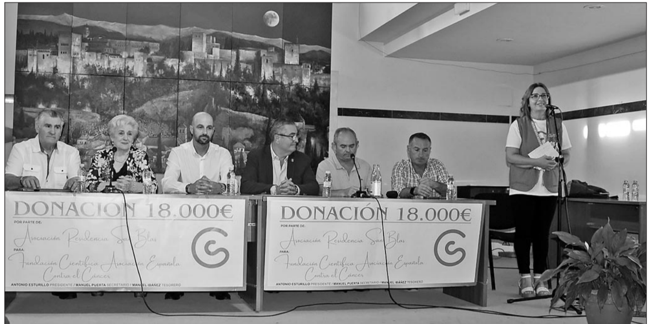
Acto de entrega.

A pesar del empeño y trabajo desinteresado de los miembros de la Asociación Residencia San Blas, la recaudación alcanzó solo 18.000 €, una