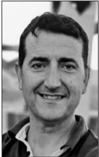
Por José Antonio Morales