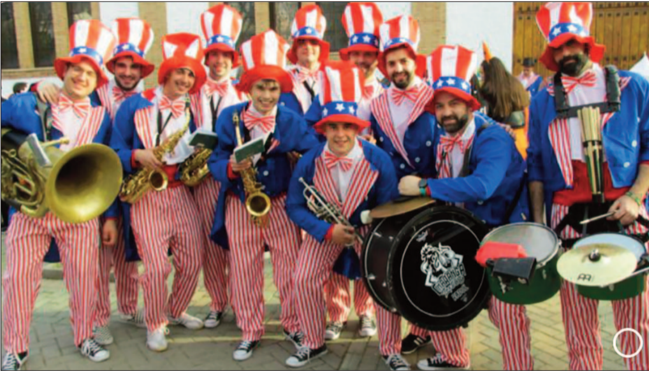
Charanga de Padul.

Redacta Manuel Ángel Martín Peregrina e informa Isidoro Villena